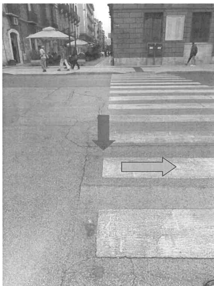
Corso Vittorio Emanuele tra civ. 82-84