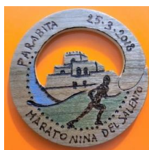
MEDAGLIA ARTIGIANALE REALIZZATA A MANO IN LEGNO DI ULIVO PER TUTTI GLI ARRIVATI

le prime 3 classificate di ogni categoria con Premi in natura