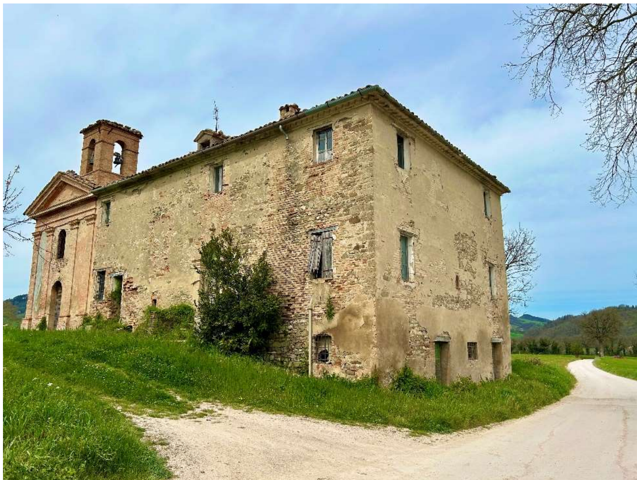
Chiesa di Sant'Eracliano.