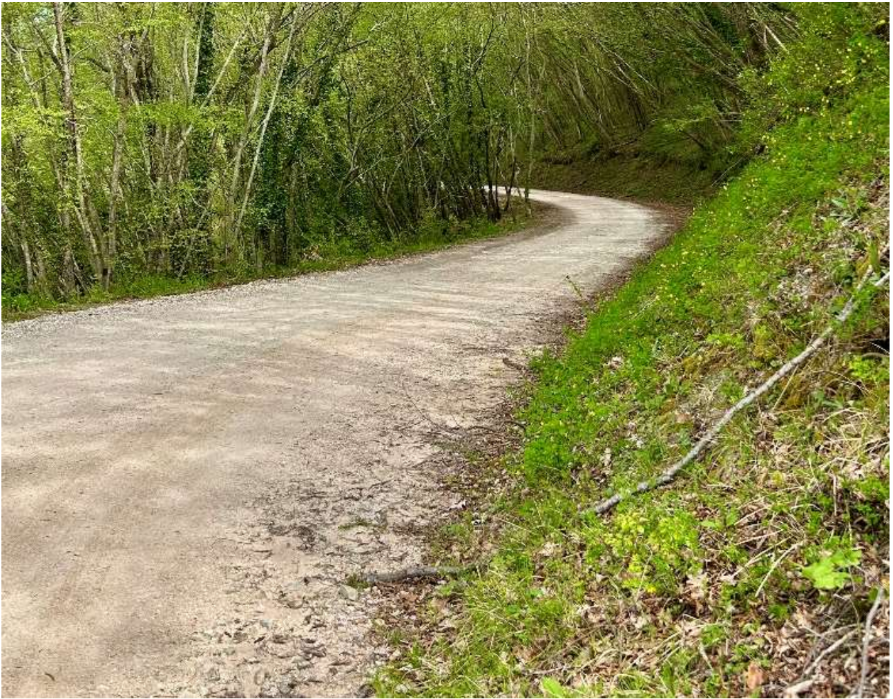
Percorso, interamente sterrato ma con un buon fondo stradale.

Urbania conosciuta fino al 1636 con il nome di Casteldurante , cambiò la propria denominazione in quella attuale in onore di papa Urbano VIII.