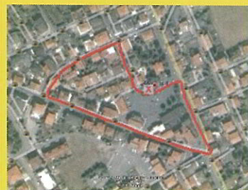
percorso Giovani 560 mt. (misurati)

Con l'iscrizione alla manifestazione 7° STAFFETTONE NOTTURNO l'Atleta autorizza espressamente gli organizzatori ed i media loro partners all'acquisizione del diritto di utilizzare le immagine fisse ed in movimento sulle quali potrà apparire, per il tempomassimo previsto dalle leggi. Con l'iscrizione alla manifestazione 7° STAFFETTONE NOTTURNO ai sensi del D.L.gs. n° 196 del 30/06/03 l'Atleta acconsente espressamente a che l'organizzazione raccolga, utilizzi e/o diffonda i dati personali dichiarati al fine di formare l'elenco dei partecipanti, di redigere le classifiche ufficiali, ed in genere, per tutte le operazioni connesse alla partecipazione alla manifestazione, nonché, per finalità promozionali, informative e per l'invio di materiale redazionale come da informativa completa che può essere visionata sul sito www.avisspinetolipagliare.org