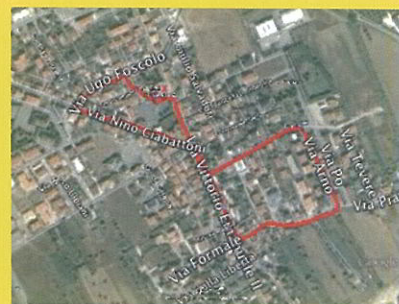
percorso Adulti 1410 mt. (misurati)