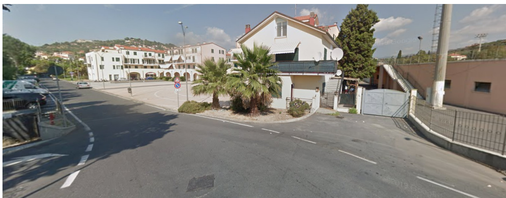
Cancello lato sud dietro tribune.