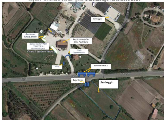
Layout “Sentiero Verde” gara Marcialonga Terralbese 2024

Dalle ore 08.30 avrà inizio il servizio navetta per il trasferimento degli atleti alla Borgata di Marceddi.