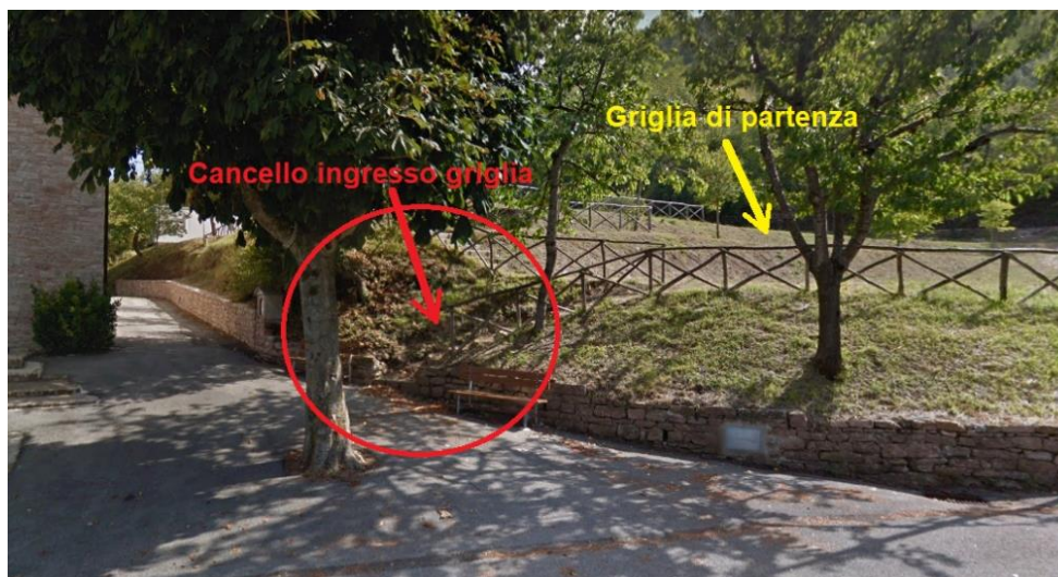
Fig. 2. Cancello d'accesso alla griglia di partenza.