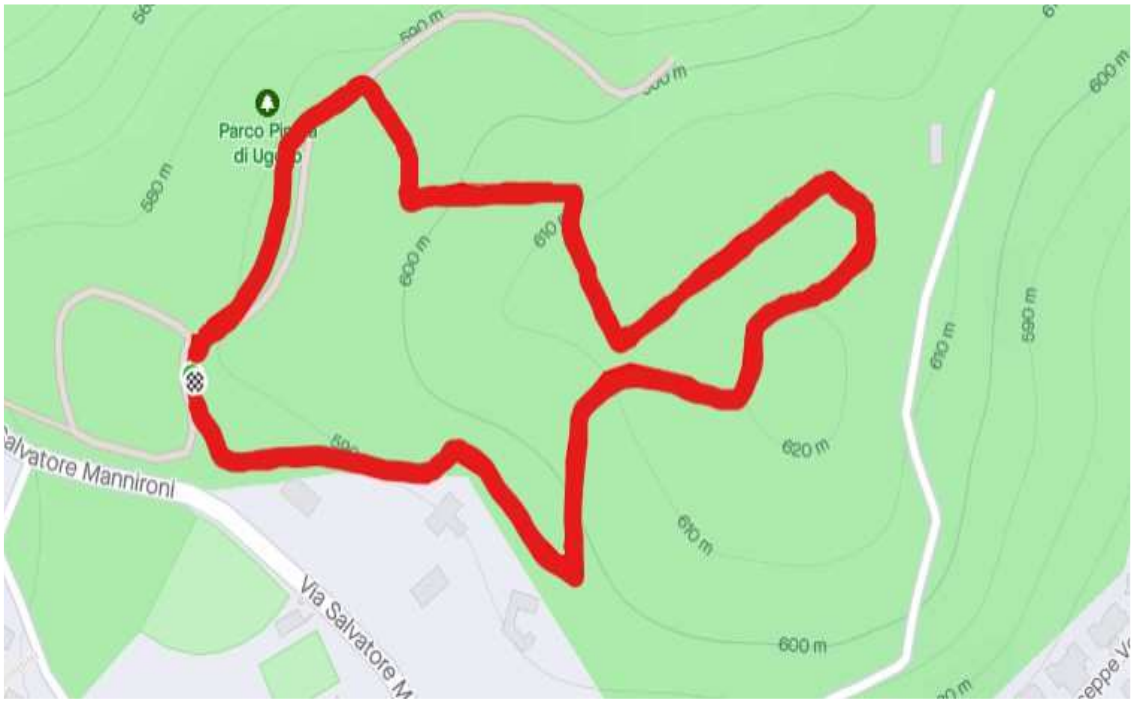
Figura 2 - Tracciato del campo di gara